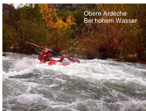
Obere Ardèche Bei hohem Wasser

Das Fahrtenprogramm der KfN e.V. ist frei zugänglich für alle Interessenten auf eigenes Risiko und unter Anerkennung und Einhaltung der KfN-Regeln im Umgang mit der Natur (siehe www.k-f-n.de ).