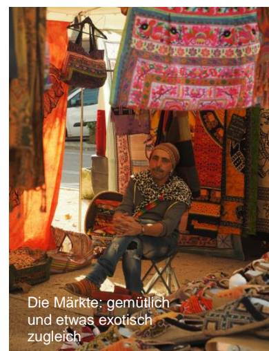
Die Märkte: gemütlich und etwas exotisch zugleich

Informiere Dich auch in unserer Fotowelt unter (ggf. in den Browser einfügen): http://www.readyshare.com/Users/kfn.richter@t-online-de/Word/Suedfrankreich.docx