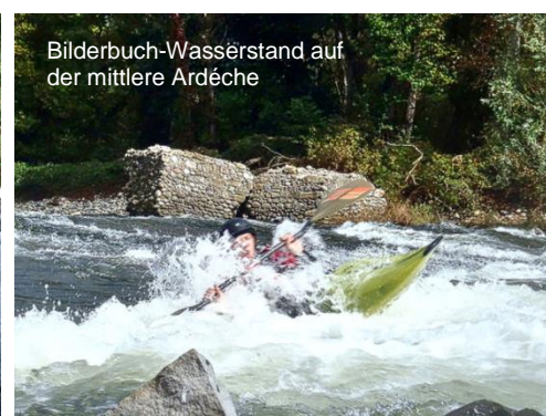
Bilderbuch-Wasserstand auf der mittlere Ardèche